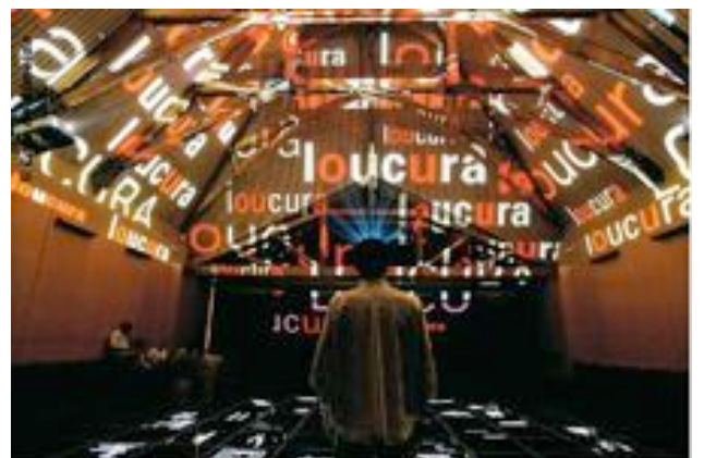
Museu da Língua Portuguesa