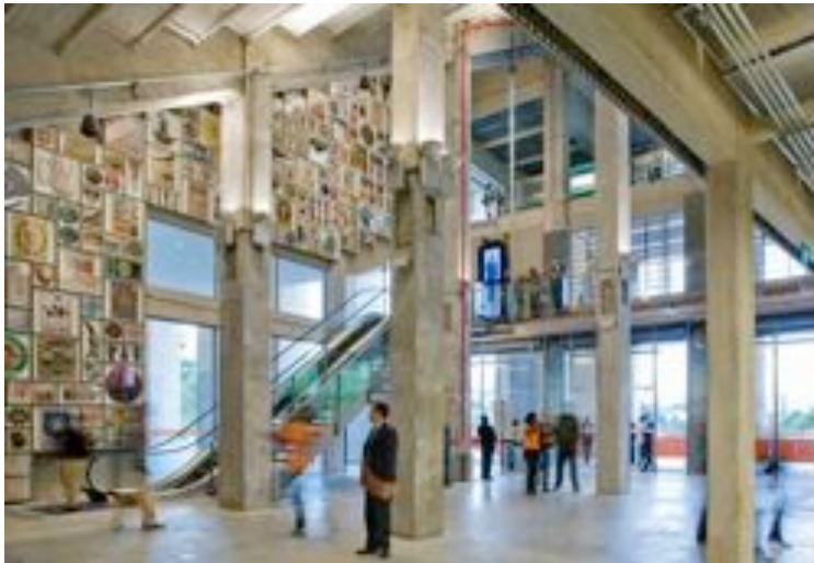
Museu do Futebol