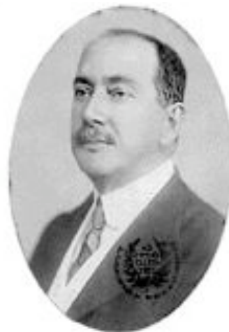
Joaquim Osório Duque Estrada

Material didático com ilustrações e textos apropriados para distribuição em escolas e instituições de ensino dedicado ao centenário da composição da letra do Hino Nacional Brasileiro.