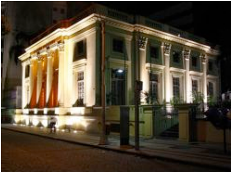
Academia Brasileira de Letras