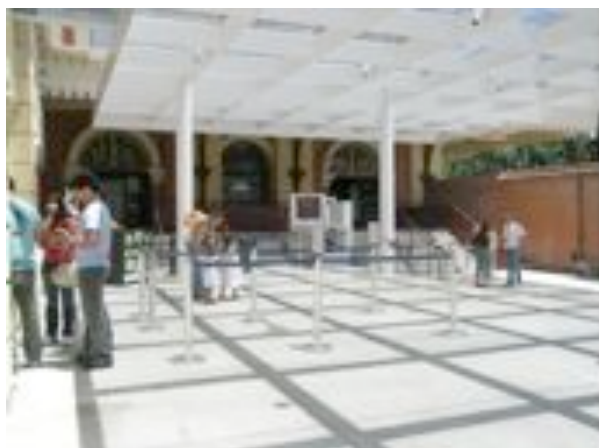
Museu da Língua Portuguesa